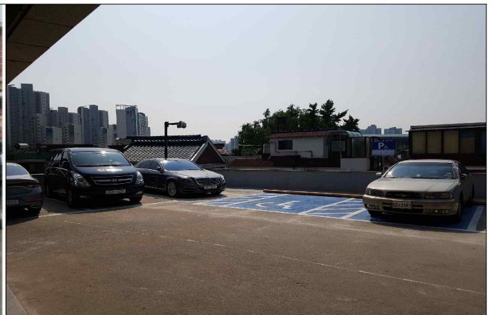
주차장 개방 후