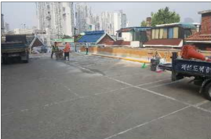
주차장 개방 전