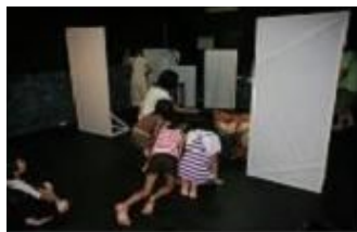
[프레 오픈 스튜디오]