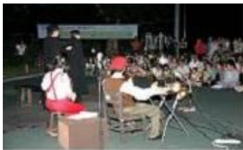
[경계없는 예술 축제]