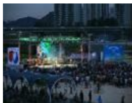
[안양천 여름 페스티벌]