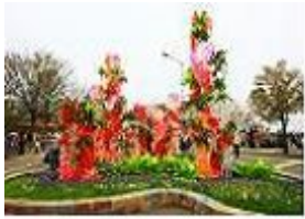
[국제 꽃장식 작품 전시]