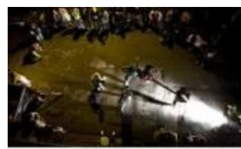
[물레 국제 아트 페스티벌]