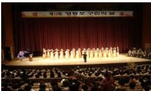
[구민의 날 기념 축하공연]