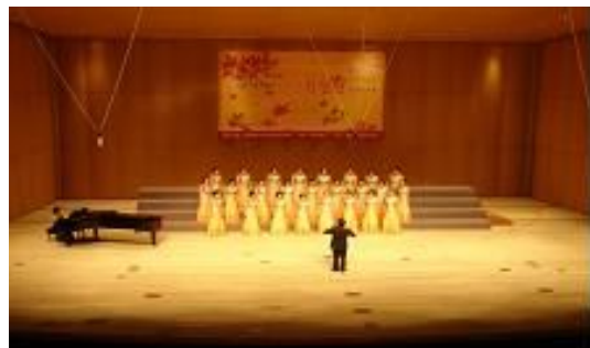
[서울시 합창단 경연대회]