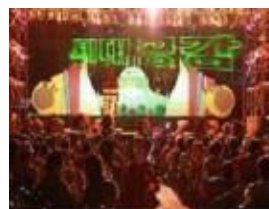
[구민사랑 BIG 콘서트]