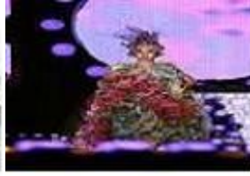
[국제 플라워 판타지]