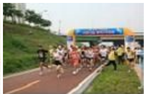
[구민 행복 달리기]