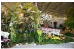
[대한민국 난 전시회]