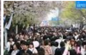
[축제 참여 시민]