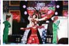
[창작 무용극 「화훼벽」]