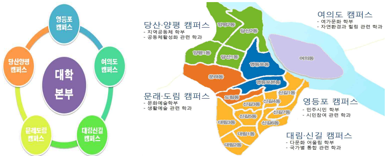
<영등포 마을대학 캠퍼스 구축 (안)>