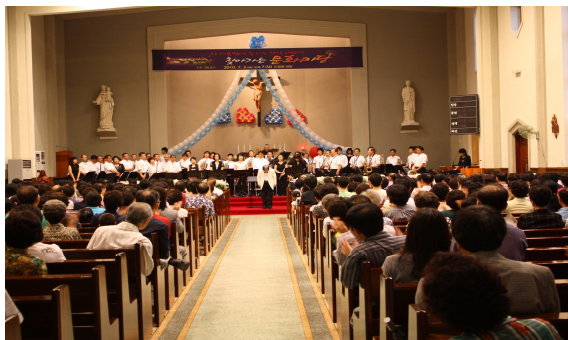
[ 윈드오케스트라 공연 ]