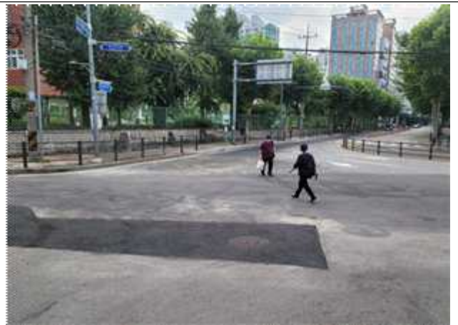
불편한 보행동선으로 상습적인 무단횡단 발생