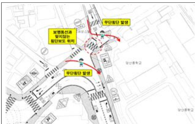
현 황 도