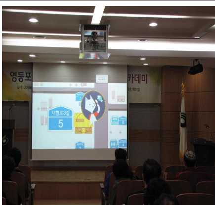
각종 교육시 동영상 상영