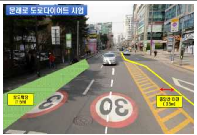
문래로 도로다이어트 사업 추진