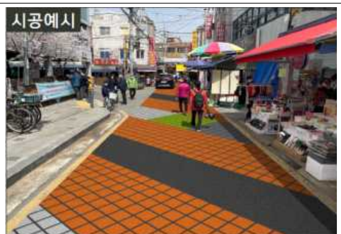
대림중앙시장 보행자우선도로 조성 예시