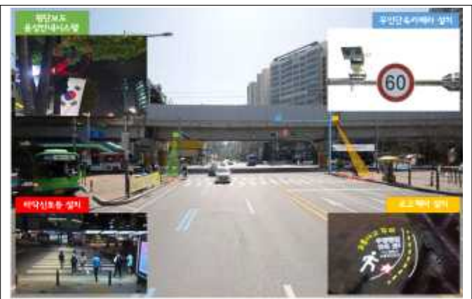
당산역 스마트교차로 설치(안)