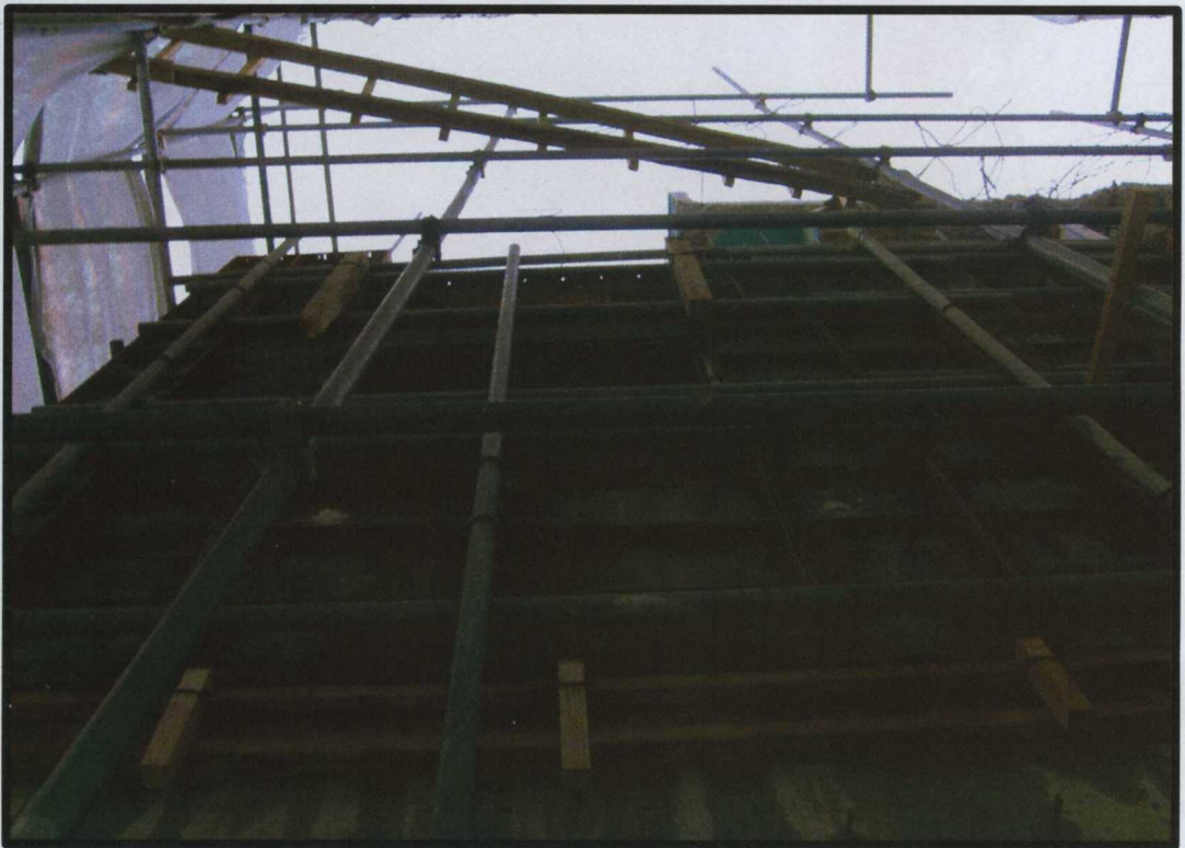
(계단실을 1개층당 약26.10㎡씩 증가시킴; 지하1층~지상2층까지)