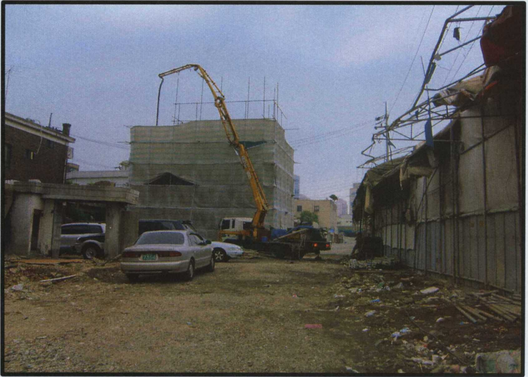
(지하1층/지상3층건물의 일부분을 무단증축 중)