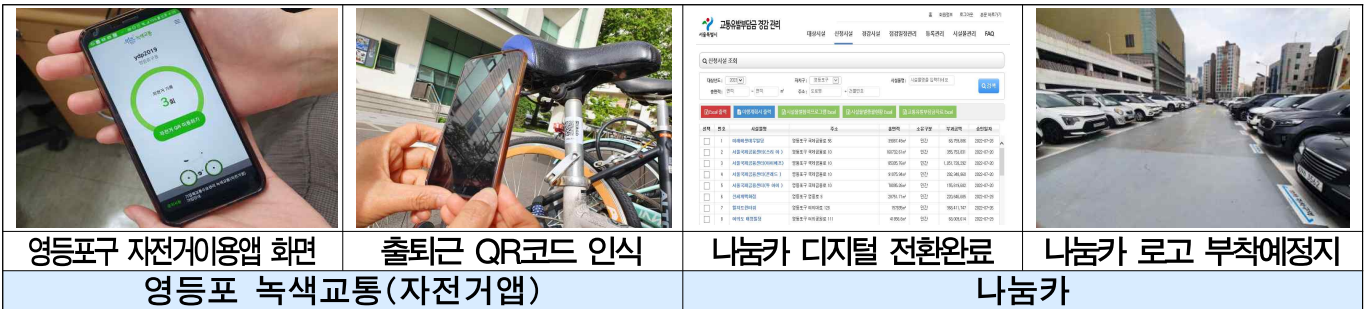
영등포구 자전거이용앱 화면 출퇴근 QR코드 인식 나눔카 디지털 전환완료 나눔카 로고 부착예정지 영등포 녹색교통(자전거앱) 나눔카