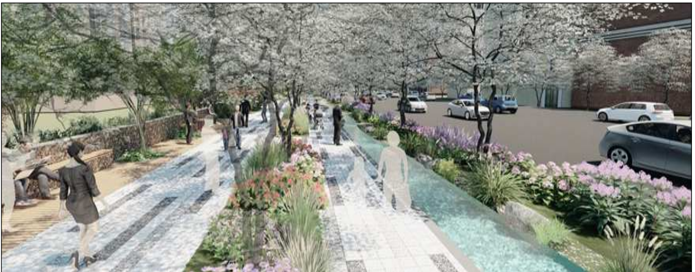
실개천 조성계획(안) (현재 설계 중으로 미확정)