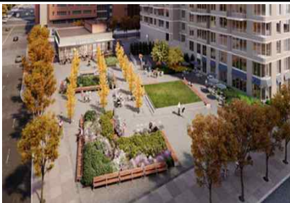
공개공지는 보행도로 개방형 설치