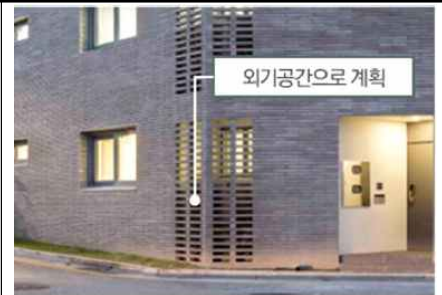
건물 내부 일체화하여 실외기 설치