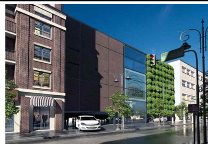
도로전면 주차타워는 본건물 일체화