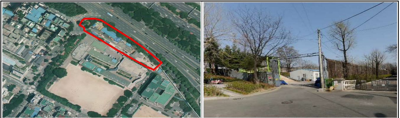
양평동 공공복합시설 내 지하공영주차장

□ 소요예산: 총 21,898,000천원 (국 2,400,000, 시 9,749,000 구비 9,749,000)