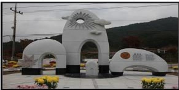
<정읍시 - 송대관 『해뜰날』 노래비>