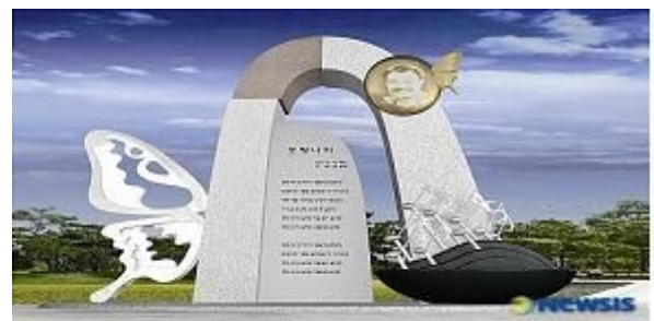
<함평군 - 김홍국 『호랑나비』 노래비>