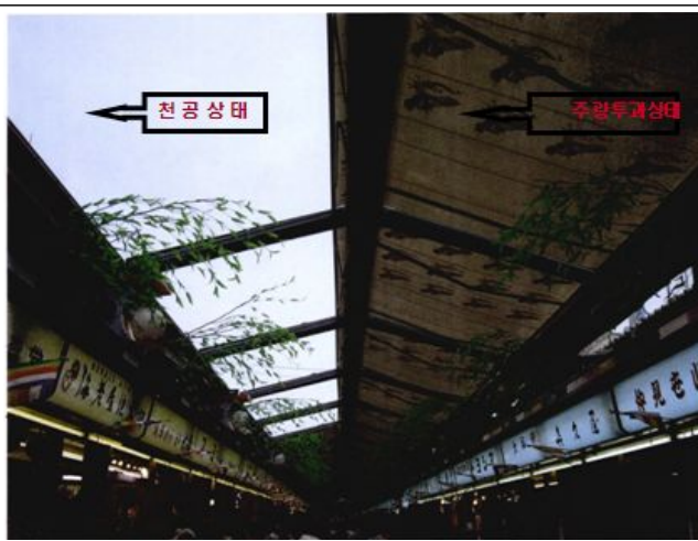
차양 한쪽을 접었을 때