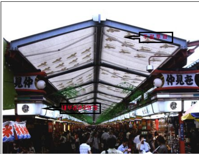
차양을 양쪽에서 펼쳤을때