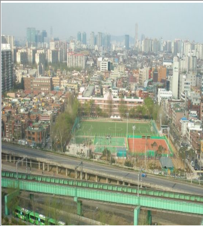
○ 지상부 전경