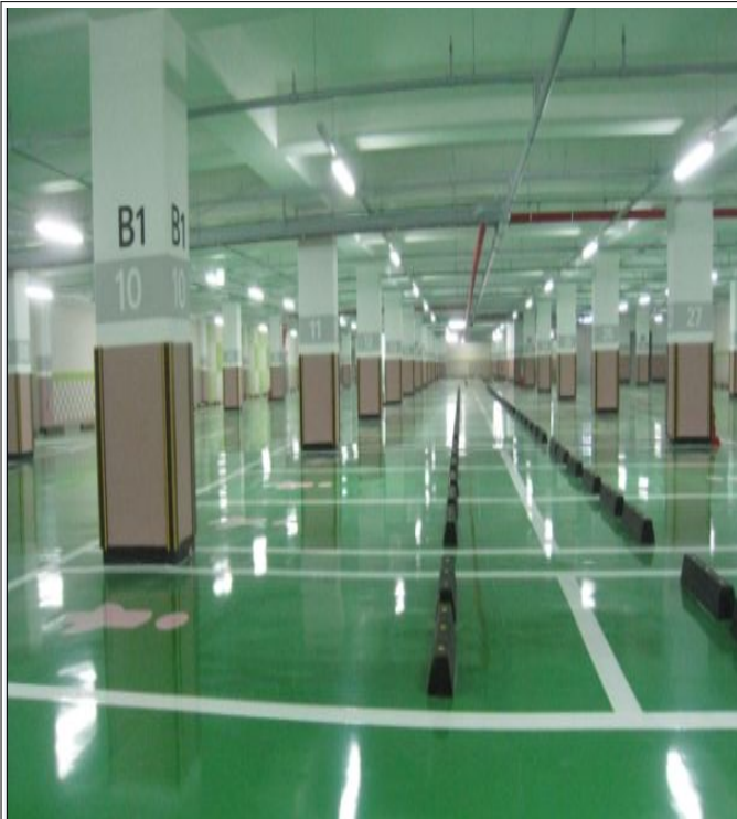
○ 지하1층 전경