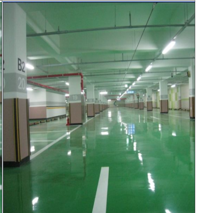
○ 지하2층 전경