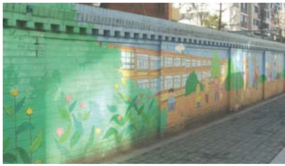
<관내 학교담장 현황사진>