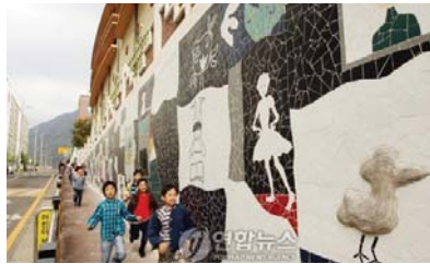
<전남화순 만연초등학교 파타일 사례>