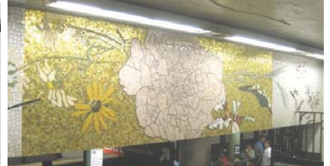
<뉴욕 지하철역 파타일 사례 >