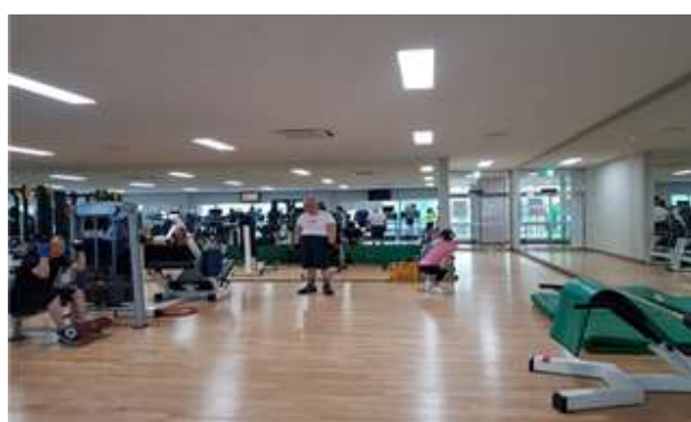
개선 전(노후 헬스기구 및 이용환경)