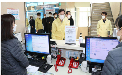
〈사업장 코로나19 방역점검〉