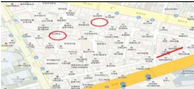
영중로4길 31 등 4개소