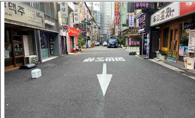
영등포로 248 일대