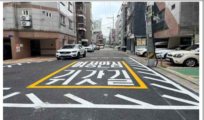
선유로53길 20 ~ 선유로53길 24