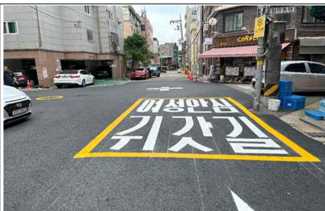
양평로18길 8 ~ 양평로18길 12