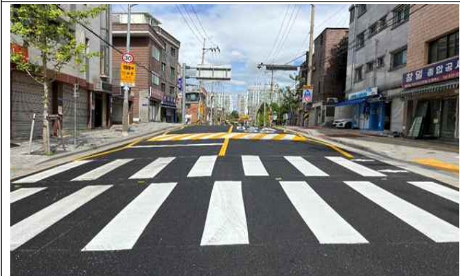
가마산로65길 16 ~ 가마산로65길 26