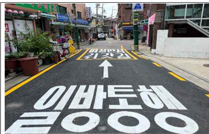
디지털로38길 17 ~ 디지털로38길 19