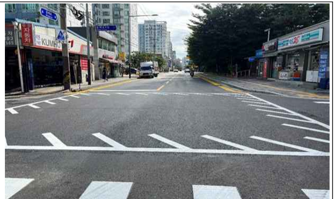
선유로 71 ~ 문래로 39