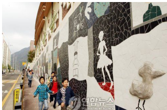
<전남화순 만연초등학교 파타일>