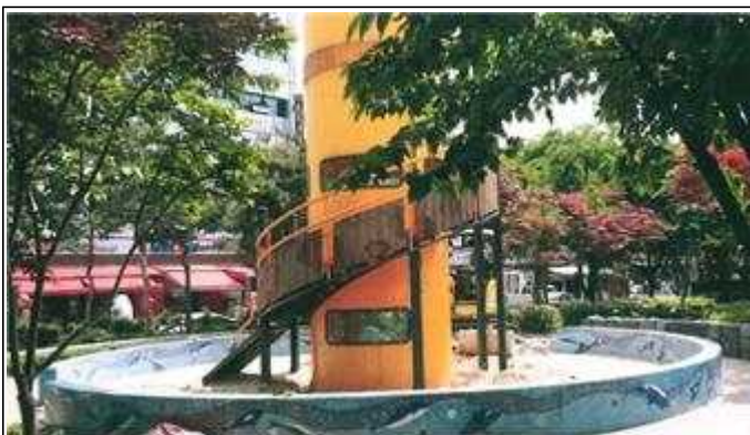
어린이공원 정비 공사전