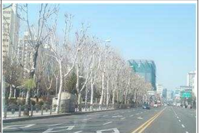
가로수 가지치기 공사후