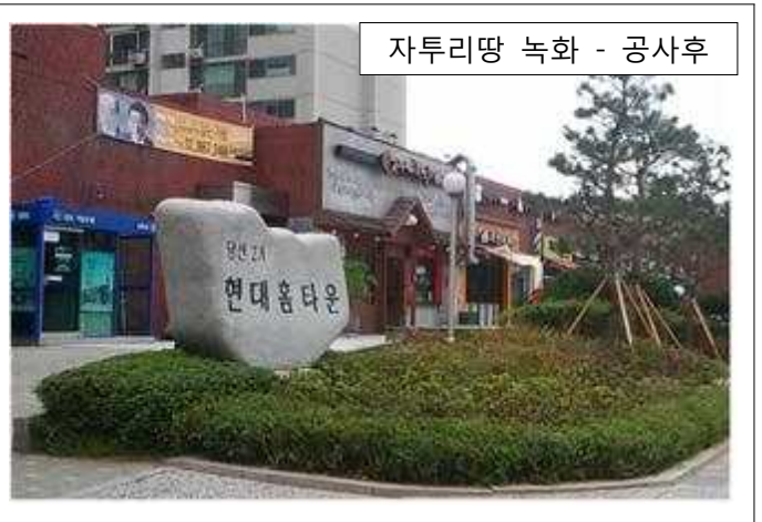
자투리땅 녹화 - 공사후