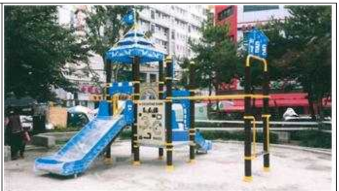
어린이공원 정비 공사후