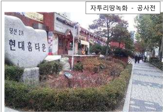
자투리땅 녹화 - 공사전