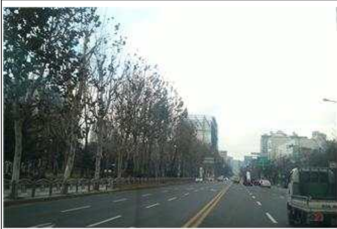
가로수 가지치기 공사전