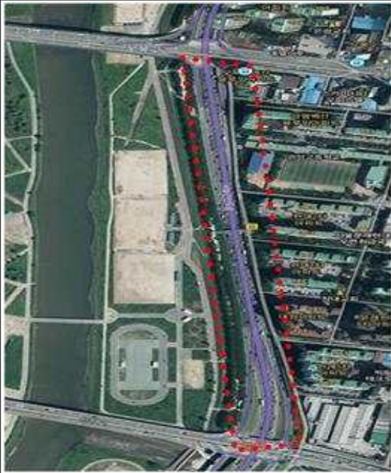
안양천(신정교 ~ 오목교)