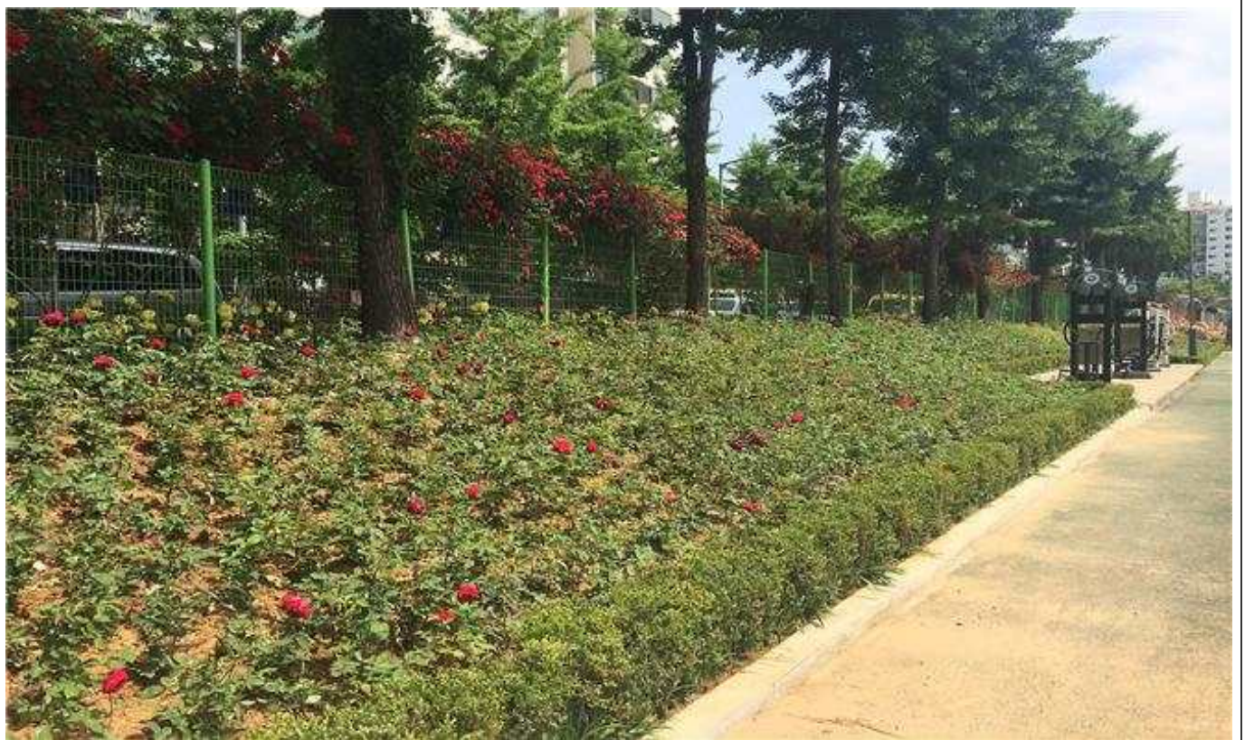
현황사진 (공사 후)