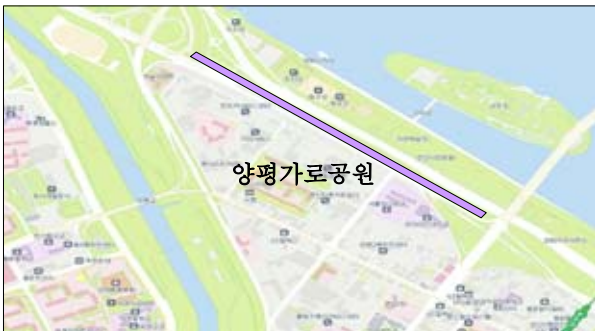
(위 치 도)