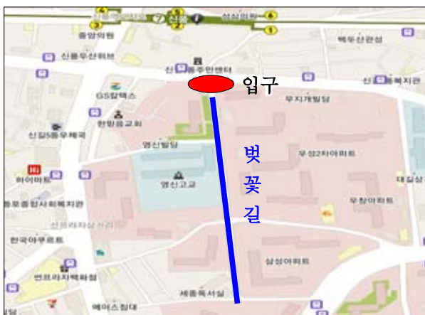
(위 치 도)