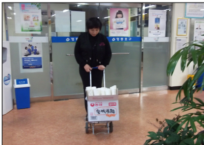
주민 동주민센터 제출