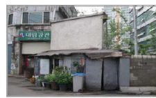
▶ 상호 : 북길네서당 ▶ 주소 : 서울시 영등포구 문래동3가 54-49 ▶ 크기 : 가로6m x 세로2.5m