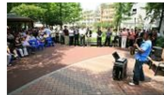
[일상의 여유 'Art in 영등포 거리 공연]