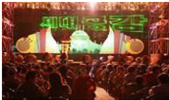
[찾아가는 구민사랑 콘서트]