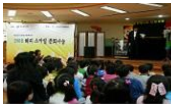
[해피스미일 문화나눔 공연]