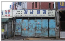
▶ 상호 : 경남철강 ▶ 주소 : 서울시 영등포구 문래동3가 54-34 ▶ 크기 : 가로6m x 세로2.5m