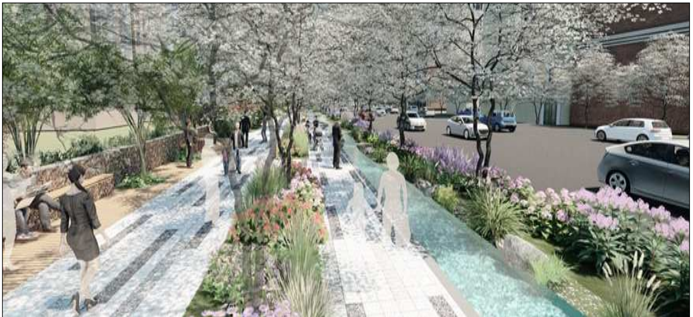
실개천 조성계획(안) (현재 설계 중으로 미확정)