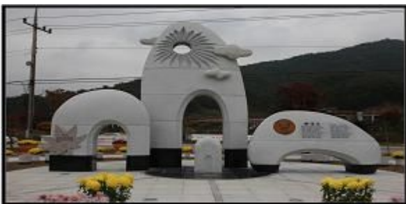
<정읍시 - 송대관 『해뜰날』 노래비>