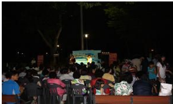
[Hot Summer!Cool Concert]