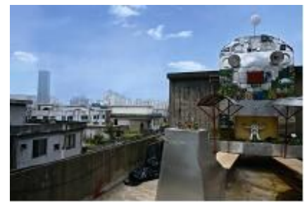
[문래 공공미술 프로젝트]