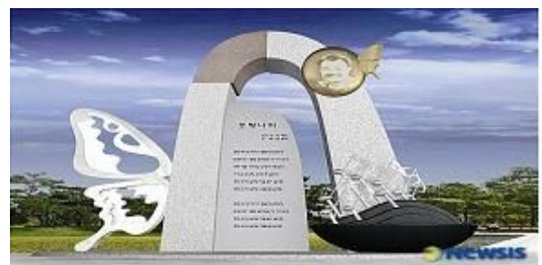
<함평군 - 김홍국 『호랑나비』 노래비>