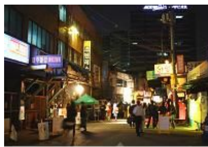
[물레 아트페스티벌 2009]