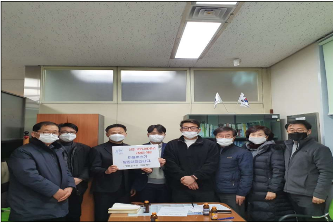
구청-마을버스 운수업체 코로나 공동대응