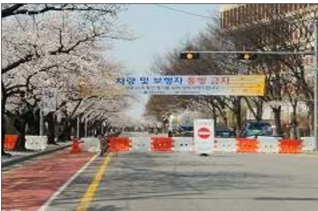
국회 뒤편 여의서로 전면 통제