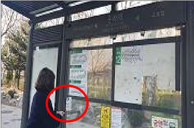
버스승차대 손소독제 설치(3. 23.)