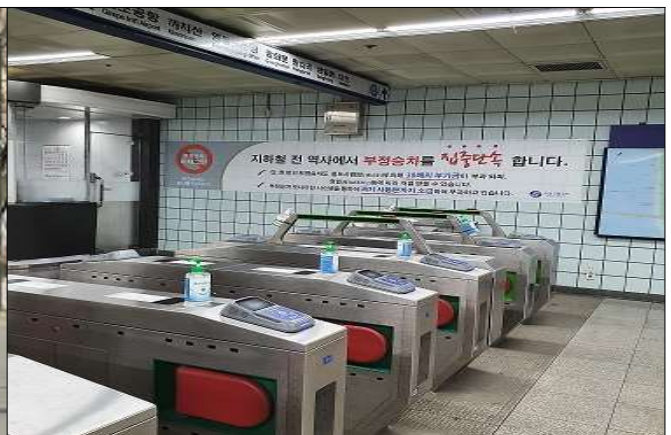
여의나루역 교통카드 태그기 손소독제 설치