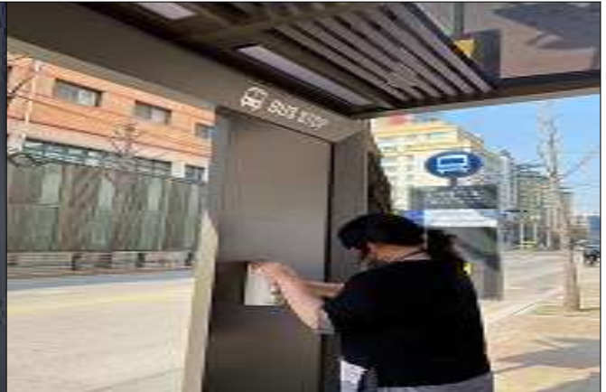
버스승차대 손소독제 설치(3. 24.)