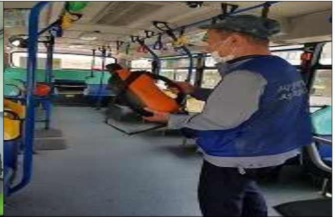
마을버스 내부 방역(영등포04)