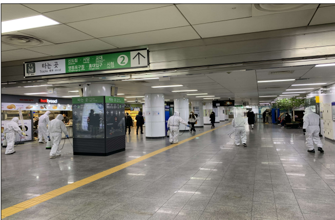
2호선 문래역 방역 상황(2. 6.)