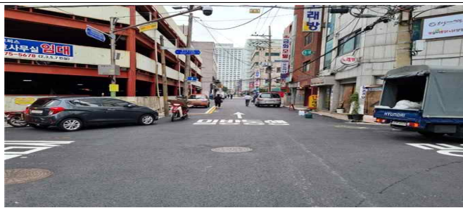
영등포 시장역 주변