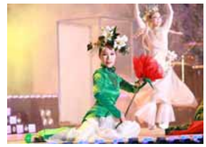
창작 무용극 「화훼벽」