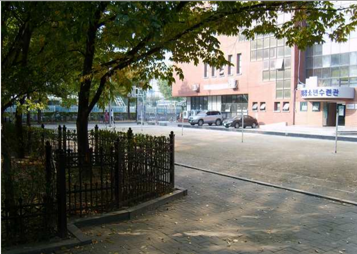
문래공원 내 신축예정지