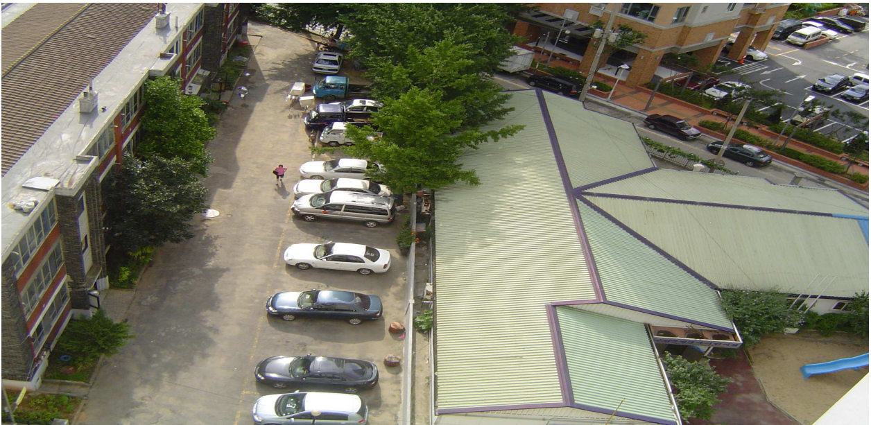
양평3가어린이집 남쪽 부근