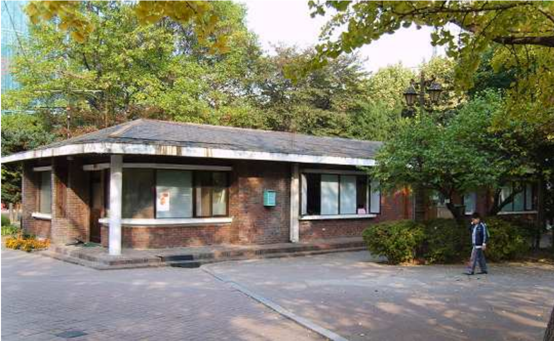
문래공원 내 기존경로당(철거예정)