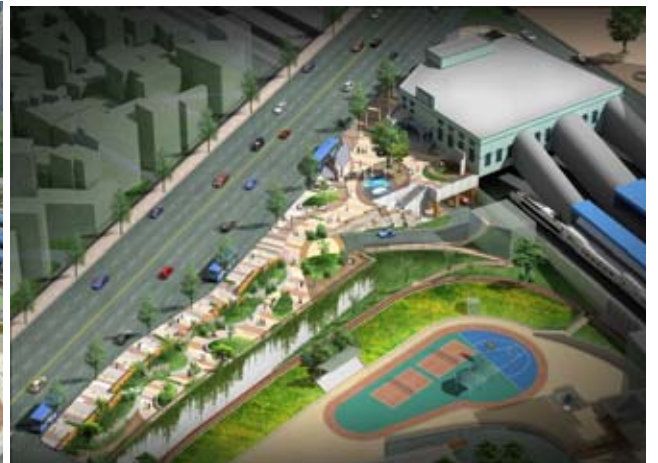
조 감 도