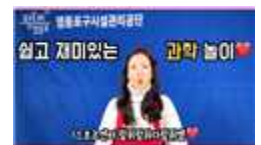
[온-택트 강좌 도입]