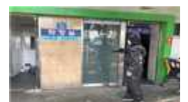
【공원 및 화장실 방역활동】