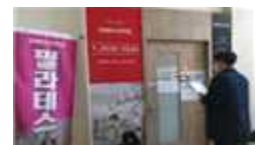
【실내체육시설 방역실태 점검】