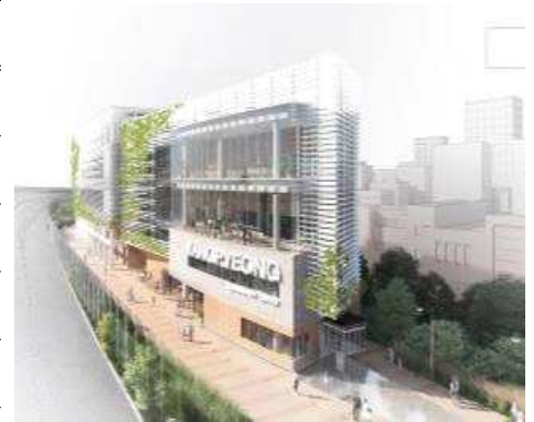
〈조 감 도〉